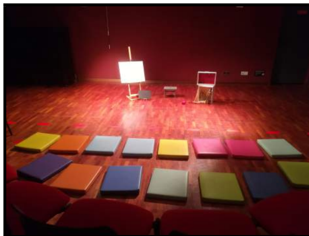
Implantation à la Médiathèque centre-ville d'Issy-les-Moulineaux (92) Représentations familiales (Décor pour le livre Le poussin et le chat )