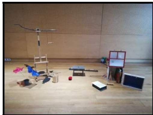
Implantation Mairie de Paris 19 e (Décor pour le livre Bonne nuit, Monsieur nuit )