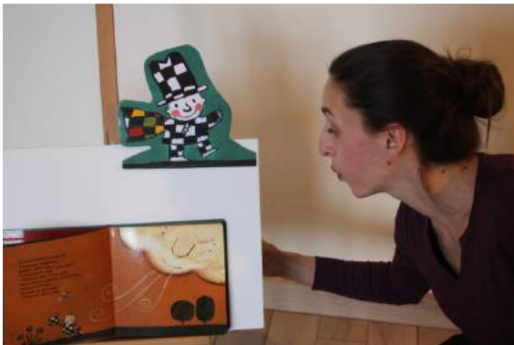
©Carré blanc sur fond bleu

Deux représentations de 20-25 mn chacune environ peuvent être jouées dans la matinée autour du même livre.