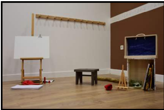
Implantation à la crèche Armand Carrel (Paris 19 e ) (Décor pour le livre Grosse colère )