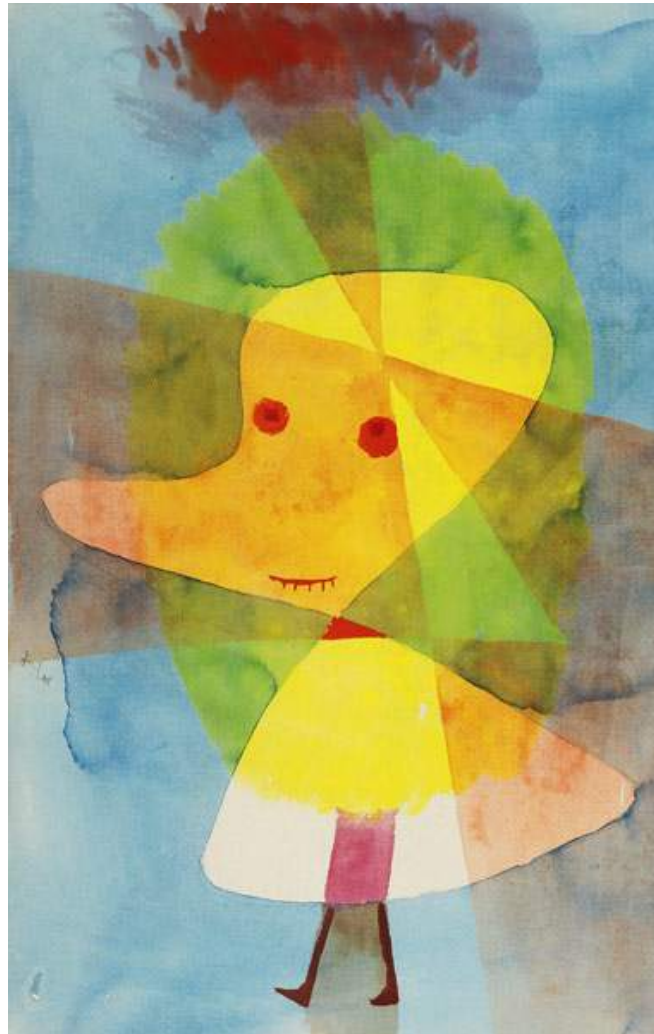
Paul Klee, Small Garden ghost