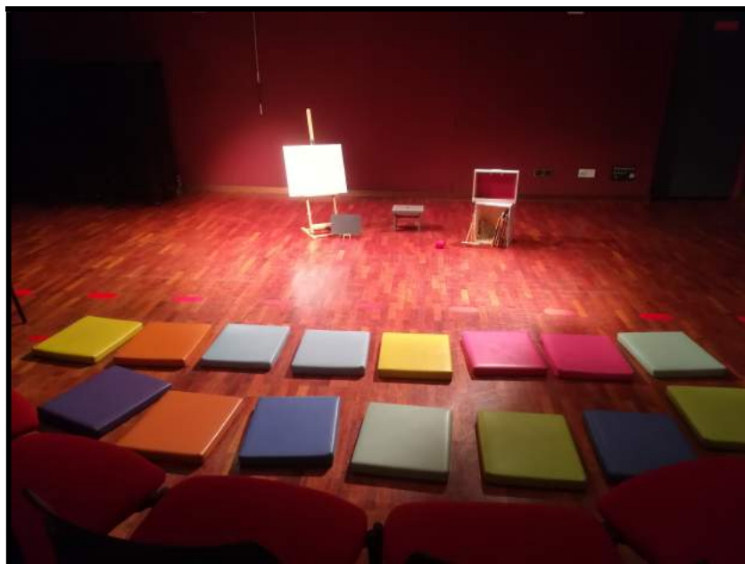
Implantation à la Médiathèque centre-ville d'Issy-les-Moulineaux (92) Représentations familiales (Décor pour le livre Le poussin et le chat )